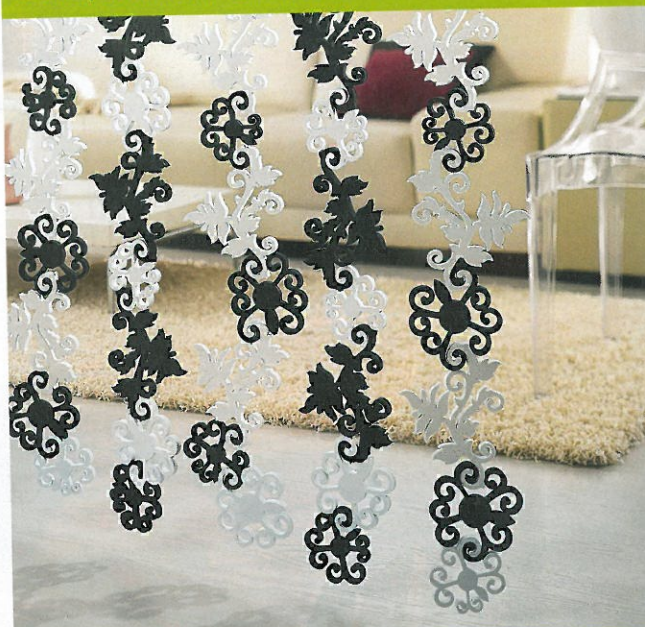
Illovedetails.com, Quille, 50 € les 6 petits panneaux